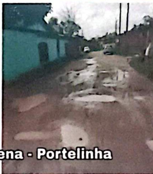
Av. Fausto Vilhena - Portelinha